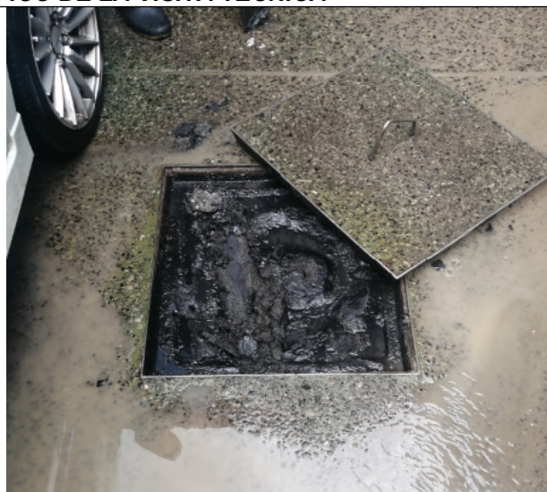
Fotografía 2. Caja de concreto y tapa en baldosa