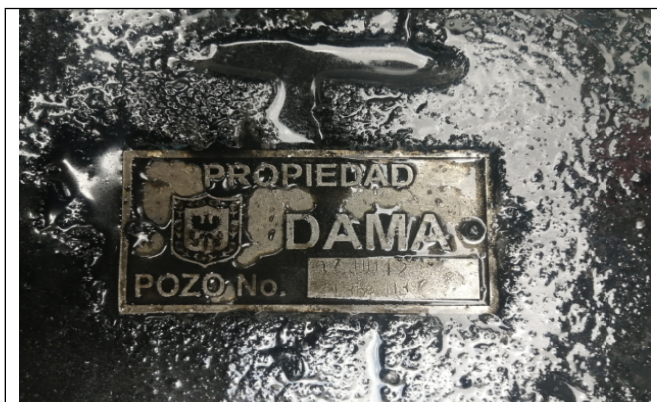
Fotografía 3. Cabeza de la captación.