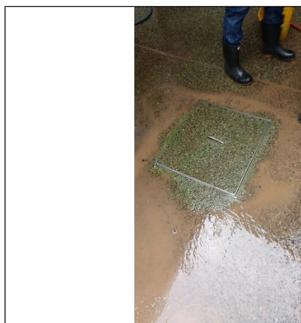
Foto No. 1 Ubicación del pozo con tapa de seguridad

Las condiciones físicas y ambientales observadas del pozo son buenas, por el sellamiento temporal encontrado sugiere que dicha actividad no representa un riesgo para la calidad del recurso hídrico subterráneo por infiltración de sustancias contaminantes en la boca del pozo.