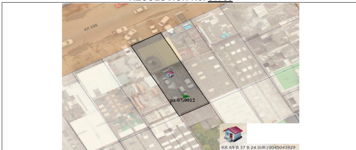
Imagen No. 2. Ubicación de los pozos en el predio con CHIP AAA0041WKBS

En el predio se lleva a cabo la actividad de lavado de vehículos, hace varios años. Durante la visita se evidencia que el pozo se encuentra cubierto con tapa de concreto, dentro de la caja de protección se evidencia lodo y barro del lavado de vehículos.