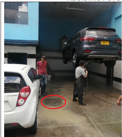
Fotografía 1. Ubicación del pozo pz-07-0012