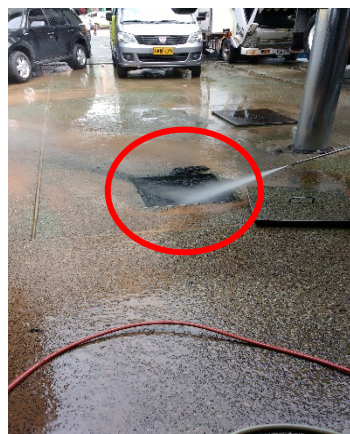
Foto No. 2 Evidencia de lodo y barro en la caja de inspección